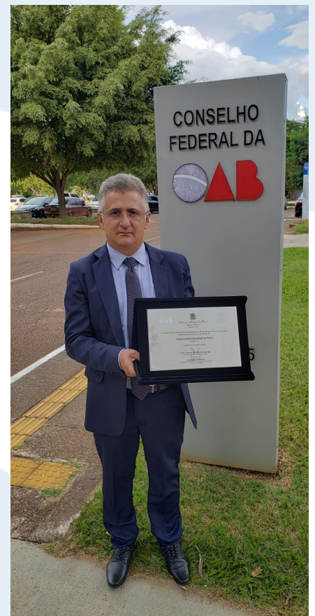
Reitor da UESPI com o selo da OAB na sede do Conselho Federal