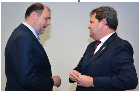
Alex Canziani, deputal federal

"A gente precisa do apoio do governo federal na manutenção das nossas universidades estaduais e o Aldo está bem preparado para buscar o reconhecimento do que as instituições têm realizado"