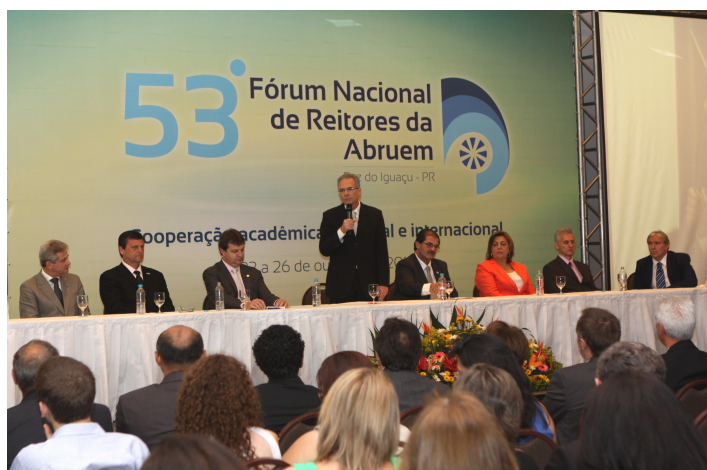
53º Fórum Nacional de Reitores Abruem, em Foz do Iguaçu

A Associação Brasileira dos Reitores das Universidades Estaduais e Municipais convida a todos os interessados para participar do 54º Fórum Nacional de Reitores da Abruem, que terá como tema central "O Desafio da Gestão das Universidades Estaduais e Municipais" e será realizado entre os dias 7 a 10 de maio, na cidade de Campos do Jordão-SP.