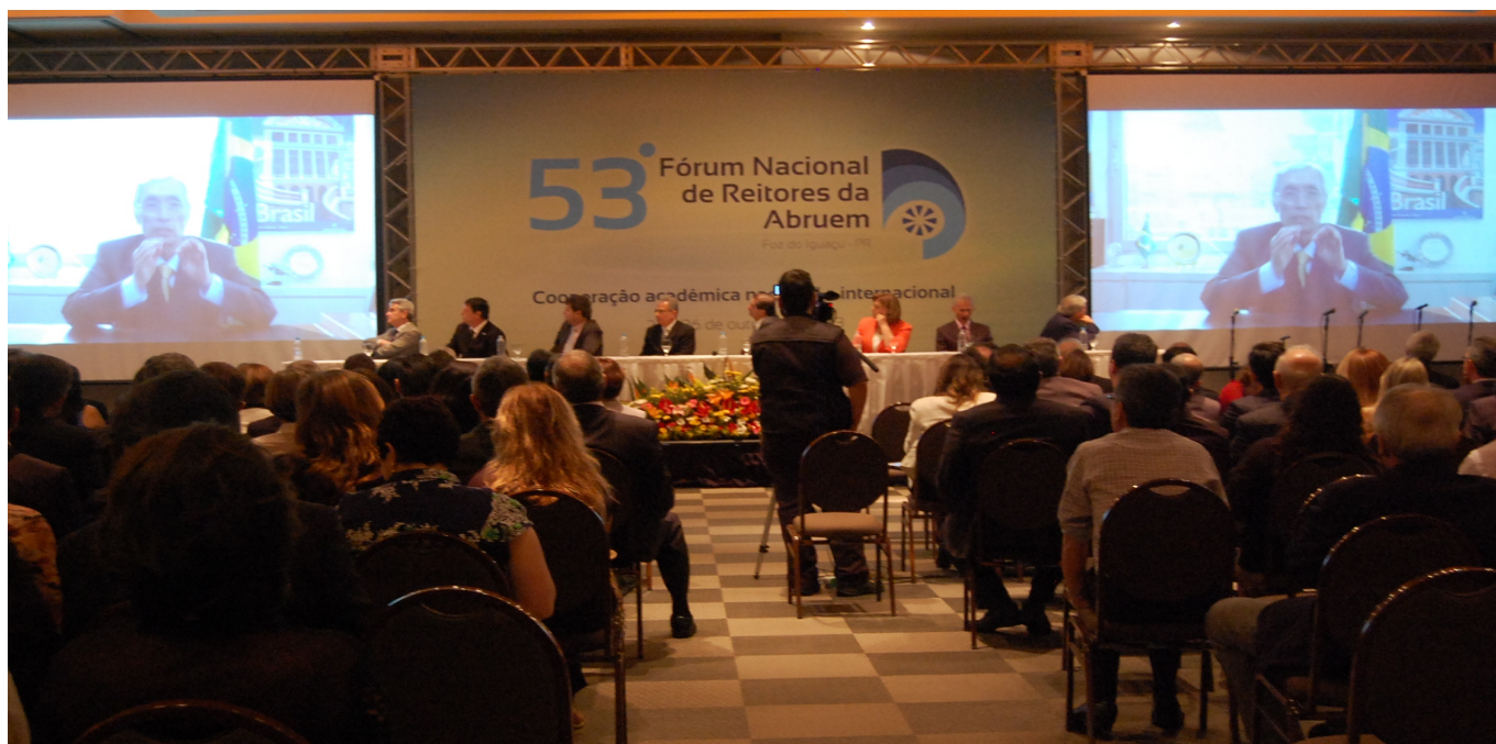
53º Fórum Nacional de Reitores da Abruem, realizado em outubro de 2013, em Foz do Iguaçu - PR

"O Desafio da Gestão das Universidades Estaduais e Municipais"