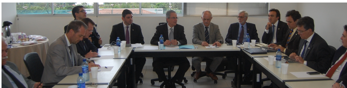
Reunião Administrativa mensal de 19 fevereiro de 2014, em Brasília

No dia 12 de Março será realizada a Reunião Administrativa mensal da Associação Brasileira dos Reitores das Universidades Estaduais e Municipais (Abruem), no Setor de Clubes Esportivos Sul (SCES), Trecho 03, Conjunto 06, térreo (auditório da Associação Médica de Brasília - AMBr), as 14h.